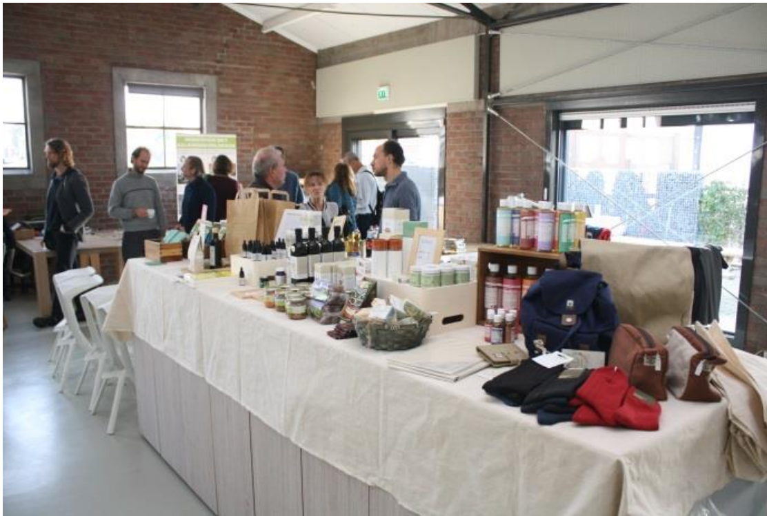
Thee, zaden, olie, verzorging, textiel van Hempie