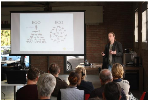
De architect niet aan de top, maar er midden in; ego vs. eco

De volledige presentatie is op te vragen bij Ralf van Tongeren, vantongeren@platform-m3.nl .