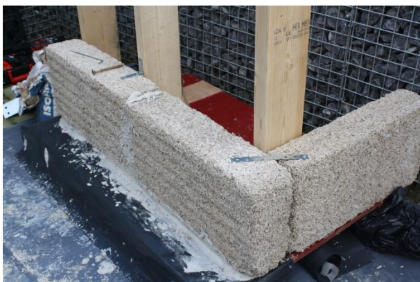
Blokken tegen een houten constructie

Dirk van Impe weet naast een praktische invulling ook een breed en diepgaand relaas te vertellen over de toepassingen en eigenschappen van kalkhenne. Zijn volledige presentatie is op te vragen: dvi@isohemp.nl